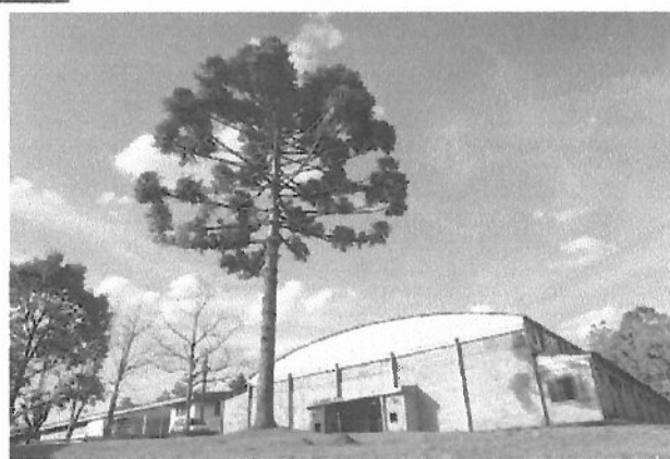
Ginásio de esportes

BOLETIM DE SERVIÇO - ANO XII NÚMERO 06 - Julho DE 1999